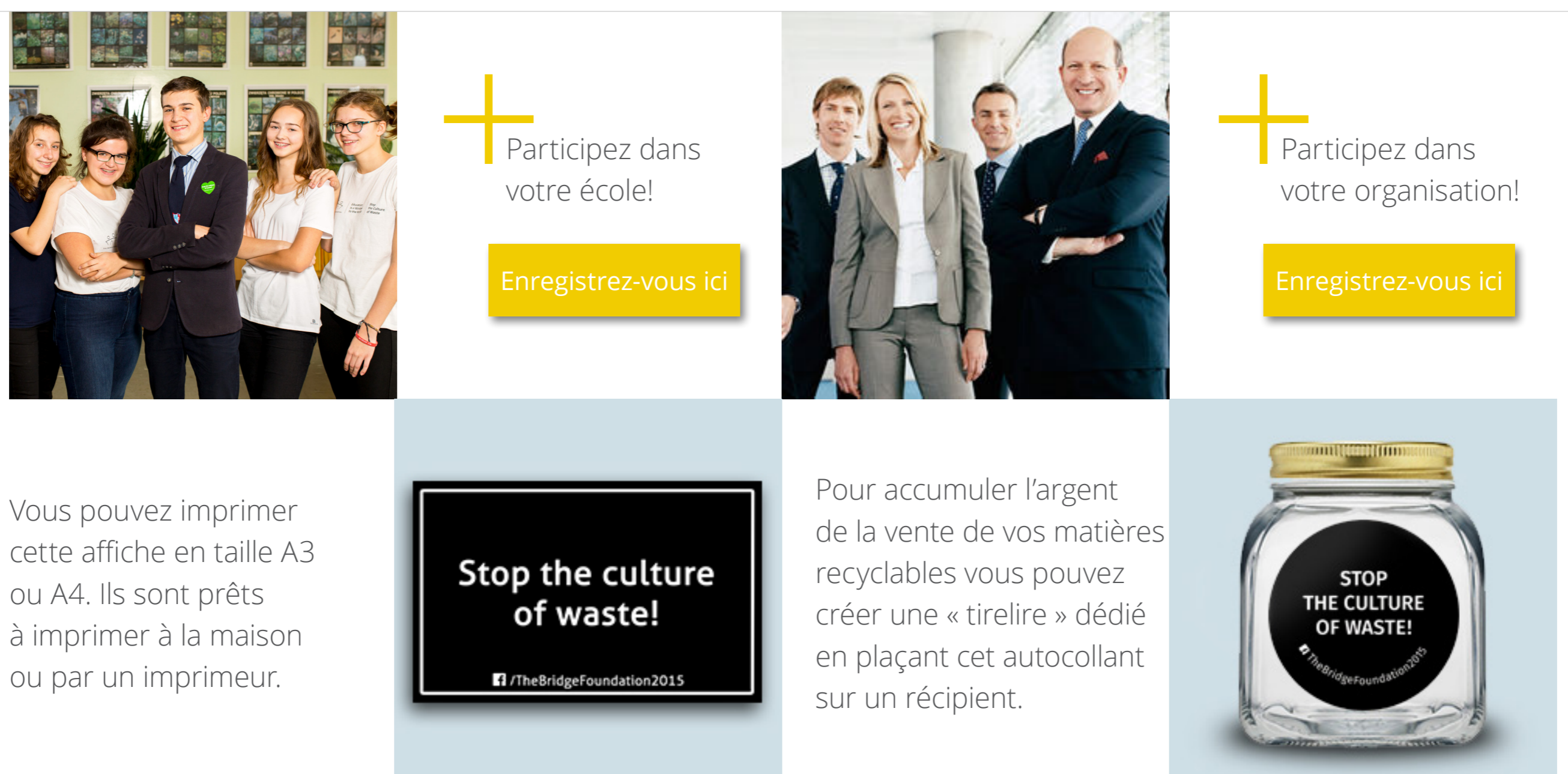
Recyclage de papier