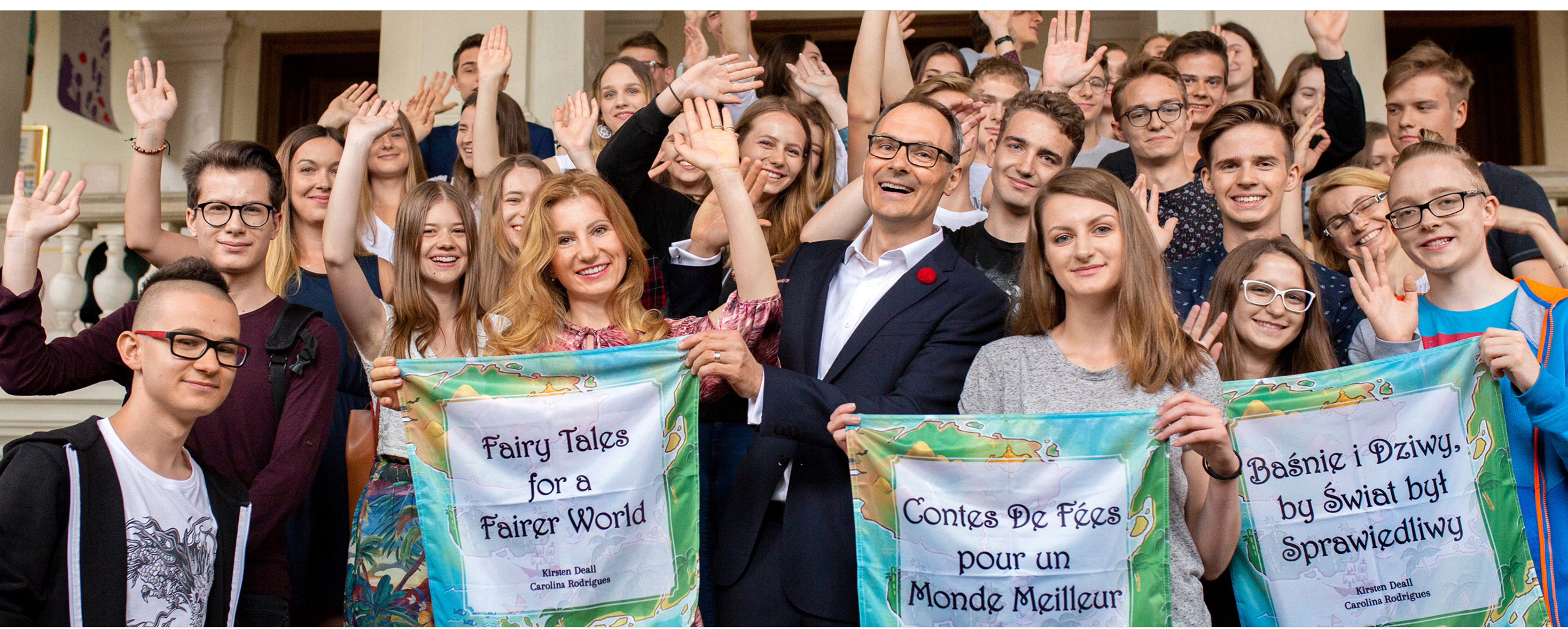
Pour relever les défis mondiaux