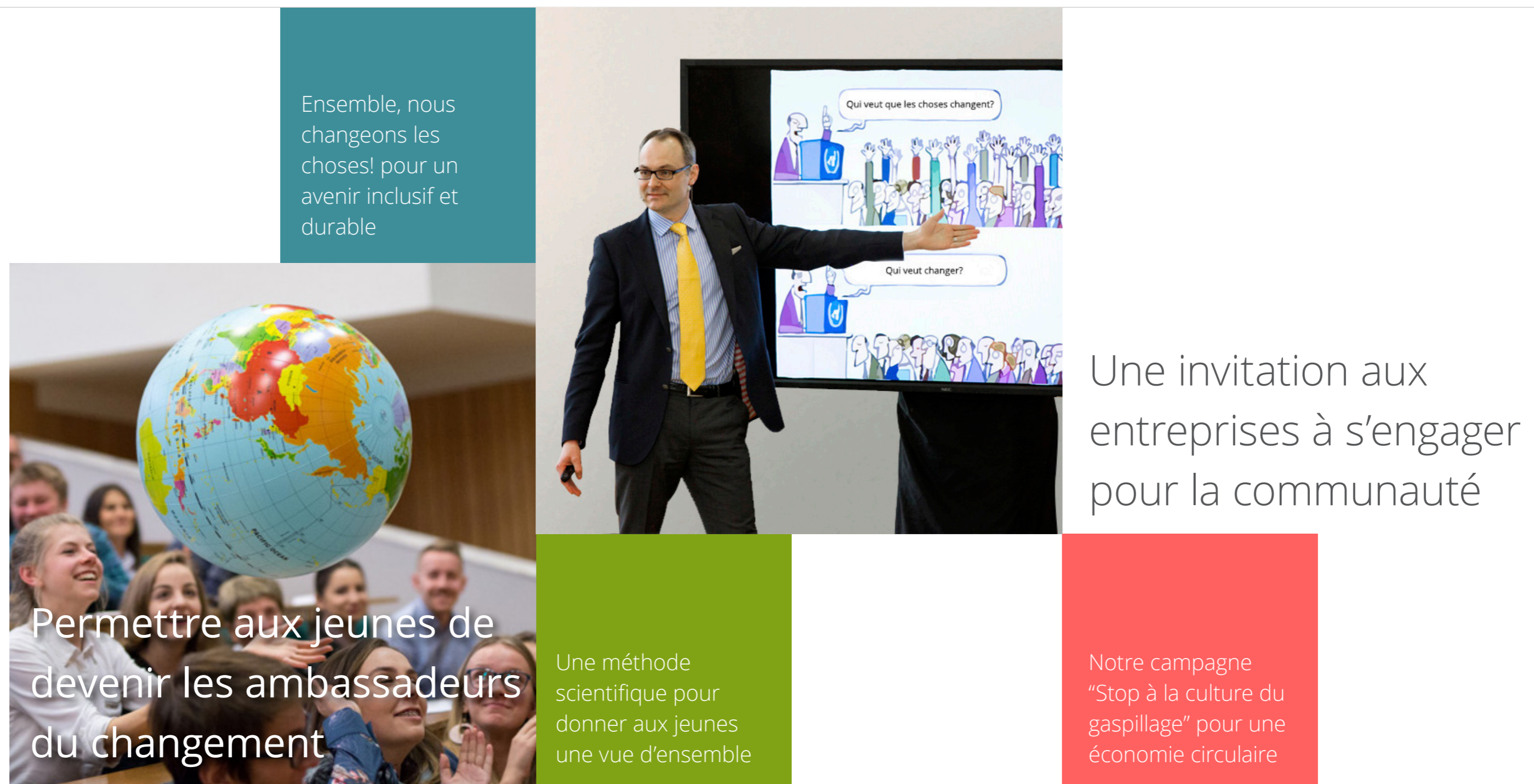
Appel à l'action!